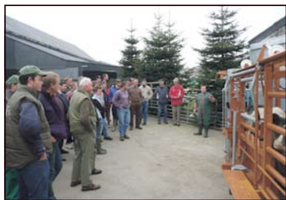
Sécurité et gain de temps grâce à un couloir de contention adapté

Voici donc un aperçu des manipulations et conseils prodigués lors de ces deux journées de formations. Il est ressorti qu'il y a de nombreuses techniques et astuces encore méconnues des agriculteurs en matière de prévention des risques et manipulations des bovins. Nous proposerons prochainement d'autres types de formation en matière de relation avec le bétail : parage des animaux, dressage chien de troupeau, conduite de télescopique, signes de vaches (qui permet de capter les signes de la vache et de les interpréter)... Le travail dans une exploitation comportant beaucoup de risques pour l'éleveur, la prudence et la prévention restent de mise. Permettre aux agriculteurs d'améliorer leur quotidien et prévenir le risque d'accidents était le centre de ces deux journées. Retenons que calme et patience sont les règles de base pour toute manipulation avec des bovins. Pour plus d'informations sur ces formations, n'hésitez pas à contacter la FJA.