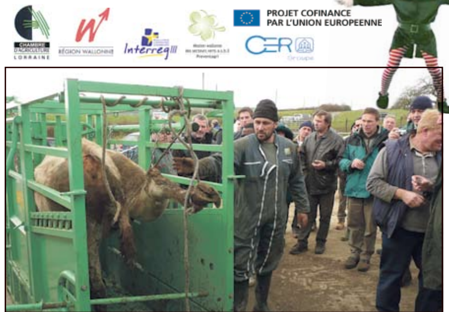
Des agriculteurs très attentifs lors du parage d'un bovin

• L'odorat est un moyen d'investigation, de contrôle et de communication chez le bovin. Son odorat étant plus développé que l'homme, il est capable de reconnaître rapidement les différentes odeurs. C'est son premier moyen/outil de reconnaissan-