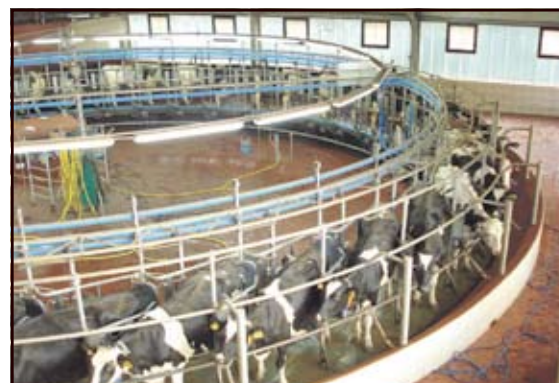
Salle de traite de 42 places de Monsieur Brunen

Arrivant à la ferme de Monsieur Brunen, notre première vision fut les 4 dômes des digesteurs.