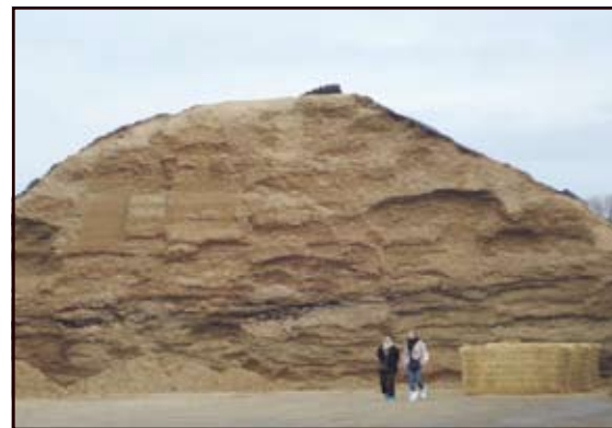
Le silo de 350 ha de Maïs

Au centre de la station de Biogaz, Monsieur Brunen nous explique brièvement son fonctionnement. Cette station permet de produire jusqu'à 750 kW heure et d'utiliser les divers déchets produits par l'exploitation notamment les restes de la ration, le fumier, le lisier,... La visite se termine par une petite tasse de café et un grand berlingot de lait chocolaté juste à côté de la maternité. Celle-ci contient 80 bêtes. Lors de notre visite, une vache venait de vêler et une autre était en